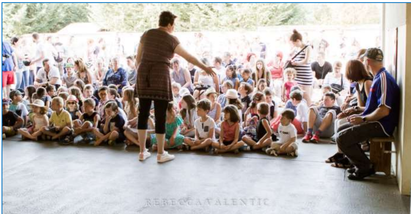
FÊTE DE L'ÉCOLE LE 30 JUIN 2018